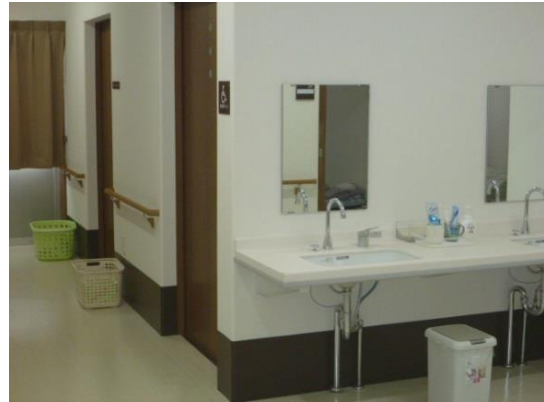
グループホーム・洗面・トイレ・お風呂