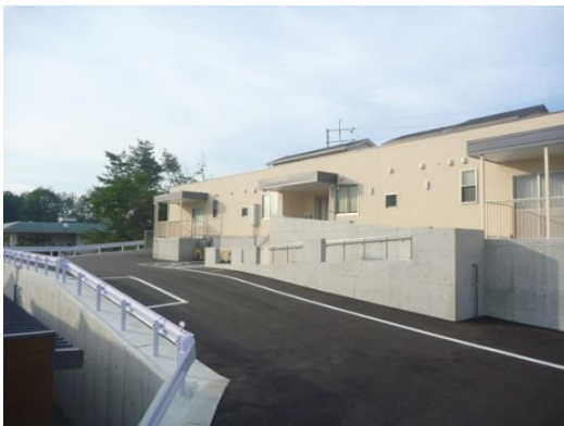
グループホーム全景

☆アクセス 春日市やよいバス停（ナギの木苑前）下車すぐ グループホームは、公益財団法人JKAの補助金で建設されました。