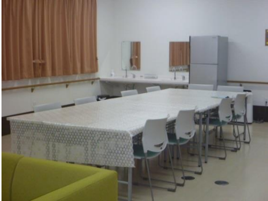
グループホーム・食堂